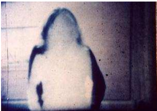
Bild: Miniature – Many Berlin Artists in Hoisdorf Copyright: Peter Tscherkassky

PRESENTATION: Österrikiske avantgarde-kortfilmaren Peter Tscherkassky hedras med en retrospektiv av sitt verk vid 30:e upplagan av den internationella kortfilmfestivalen i Uppsala. Även några ytterligare österrikiska kortfilmer kommer att visas.